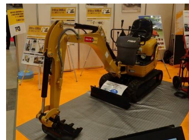
当日展示したミニ油圧ショベル010CR