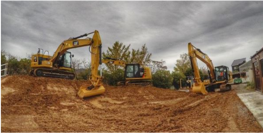
オープン当日のデモンストレーションの様子

名称 : D-Tech Center Satellite 豊橋 住所 : 〒441-3155 愛知県豊橋市二川町字川田23-1 総面積 : 750㎡ 建物 : 78.29㎡ 50人収容 保有機械 : 油圧ショベル Cat 320 (3Dマシンコントロール仕様) 油圧ショベル Cat 312F (3Dマシンガイダンス仕様) ブルドーザ Cat D3K2E (3Dマシンコントロール仕様) 目的 : i-Constructionの普及促進、最新技術への理解とICTに熟知した人材の育成