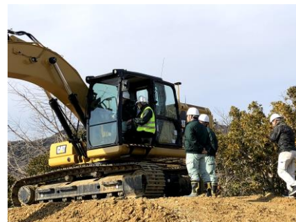
MC機能を用いて操作

Trimble Business Centerの概要全般を学習後、D-Tech Center Satellite豊橋を現場に見立てて3D設計データを作成。作成した3D設計データはクラウドとUSBを経由して、新型油圧ショベル「Cat 320」に転送し、MC（マシンコントロール）機能を用いて実際の施工も体験いただきました。